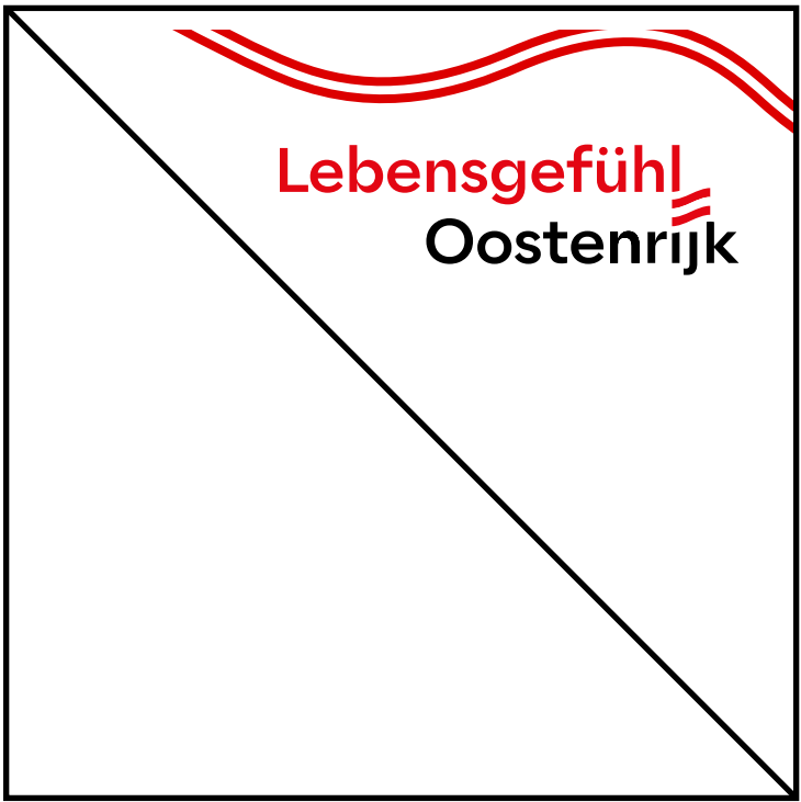
Vibe nicht abfallend