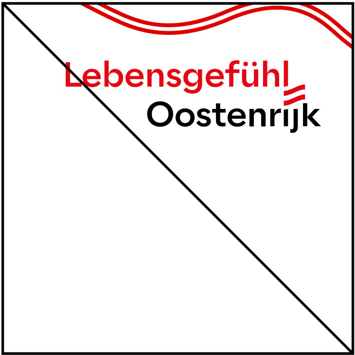
Logo größer gezogen als Vibe (die Stärke des Vibes richtet sich nach der Größe der Logo-Flagge)