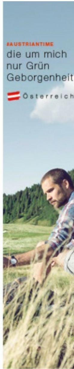
120 x 600 px