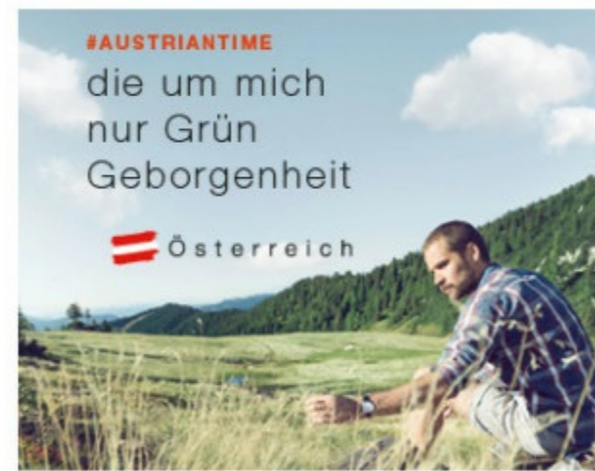
300 x 250 px