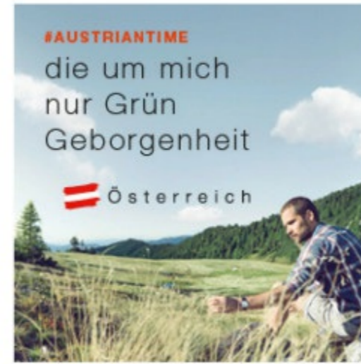
250 x 250 px