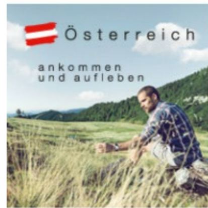
200 x 200 px

Ist die Bannergröße zu klein, um Hashtag, Headline und Logo abzubilden, wird der Inhalt auf das Bild und das Logo reduziert. Einzig der Claim „ankommen und aufleben“ kann frei auf das Bild gesetzt werden.