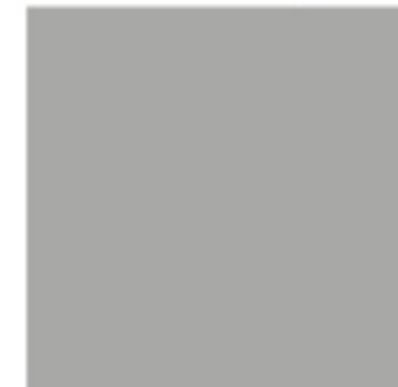
Grau 2 CMYK: 0/0/0/45 RGB: 175/175/175