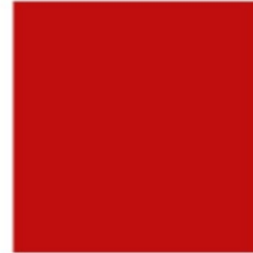
Dunkelrot 1 CMYK: 0/100/100/20 RGB: 168/23/26