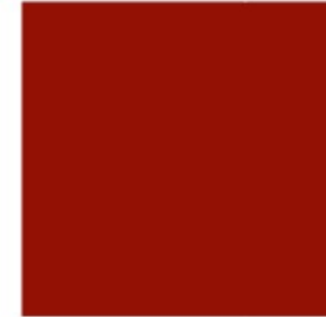
Dunkelrot 2 CMYK: 0/100/100/45 RGB: 130/18/11